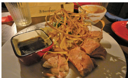
牛ステーキ ゴボウから揚げ