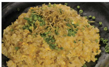
しらすチャーハン