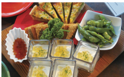
キッシュ エビ揚げパン 冷製クリームジュレ