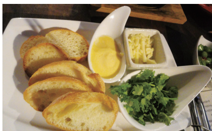
アリオリソース バケット チーズ パクチー