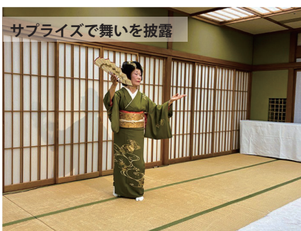
サプライズで舞いを披露