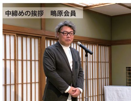
中締め挨拶 鳴原会員